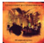
Milagro Acustico I storie o caffè di lu furestiero novo