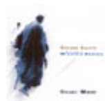
Piccola Banda Ikona Stari Most