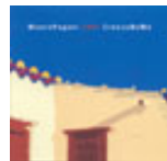
Mauro Pagani Creuza de ma 2004